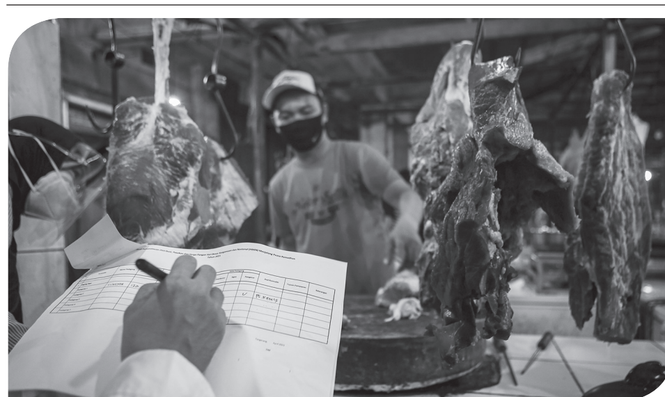
SIDAK PASAR JELANG RAMADHAN